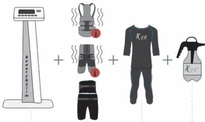
TOESTEL MET STATIEF